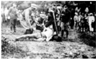
图二 (地点: 北平)