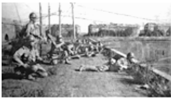
图一 (地点: 沈阳)