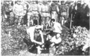
图三 (地点: 南京)